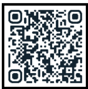
کانال اطلاع رسانی در ایتا