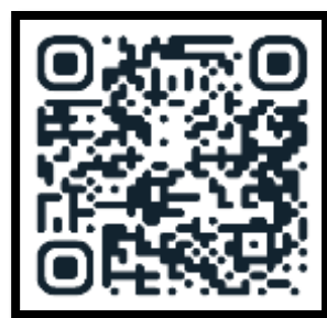
کانال اطلاع رسانی در بله

اداره توسعه فعالیت های قرآن و عترت دانشگاه علوم پزشکی شیراز